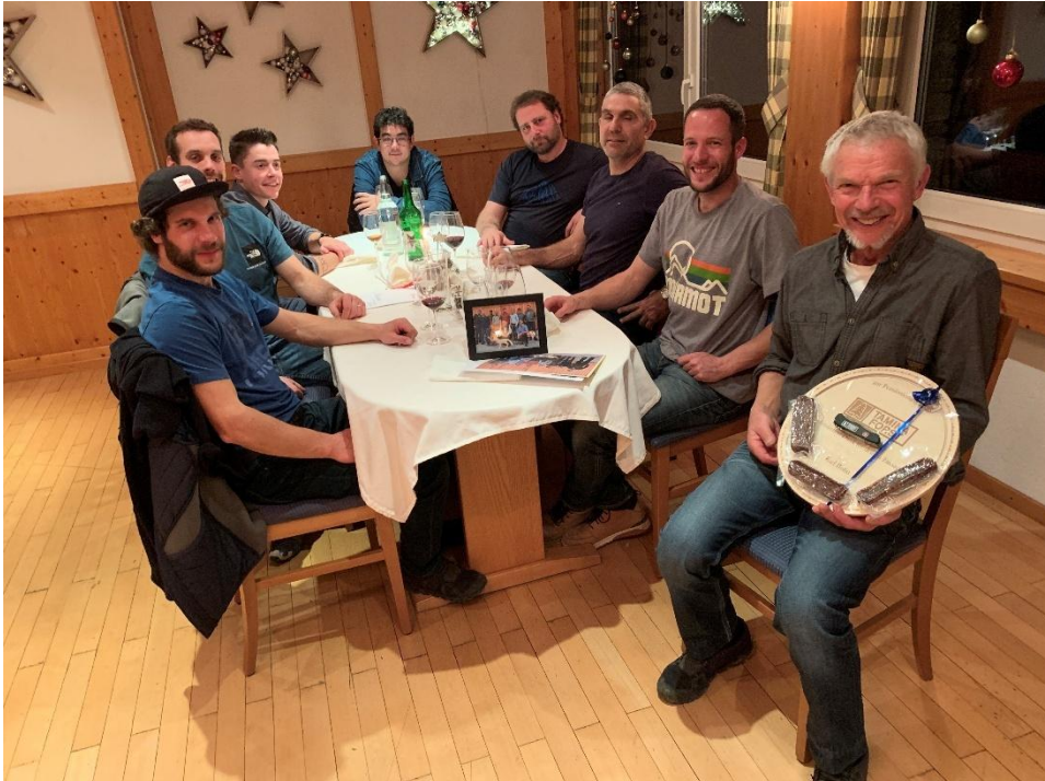
(Abb.) Weihnachtsessen im Restaurant Paradies Bad Ragaz: