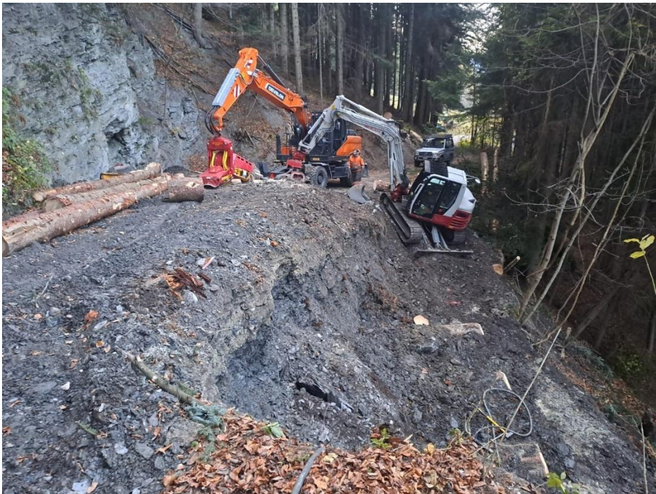
(Abb.) Holzkastenverbauung Romanei