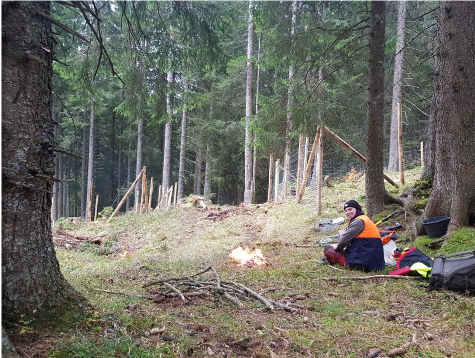
(Abb.) Erstellung Wildschutzzäune, Waldreservat Pardiel: Forstwart Titus Klingler