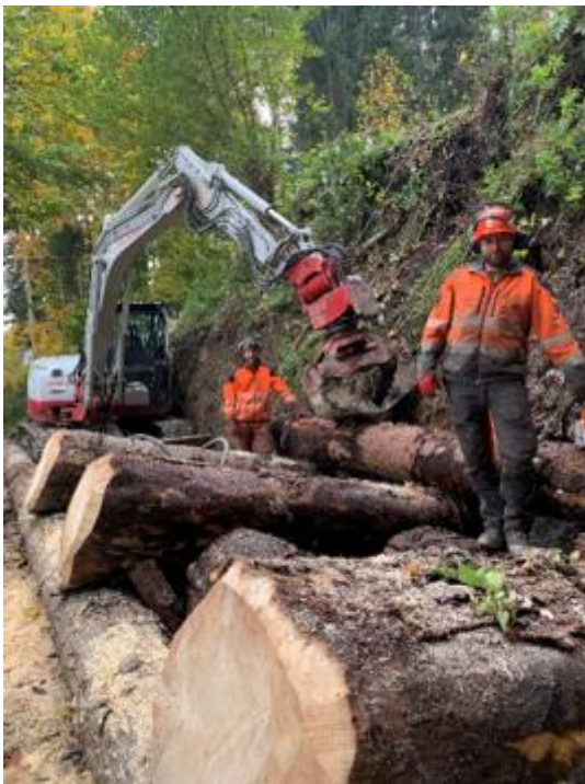
(Abb.) Hangsicherung Wildbodenstrasse