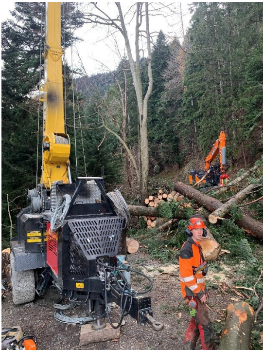
(Abb.) Seilschlag Wächtersberg, Romanej: Forstwartlehrling Levin Aggeler beim Abhängen der Lasten