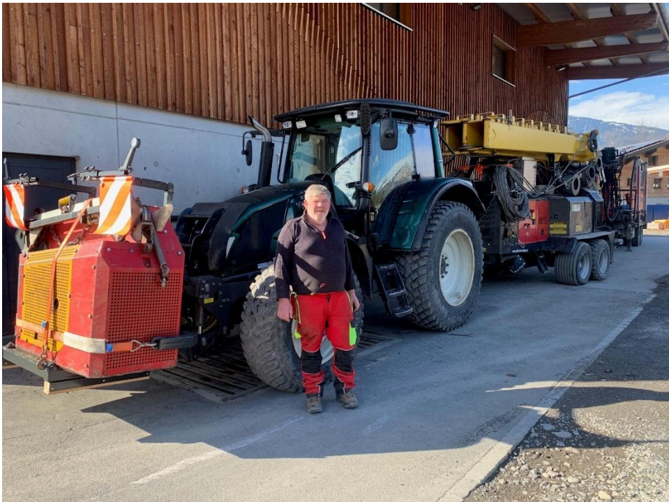
(Abb.) Transport Mobilseilkran