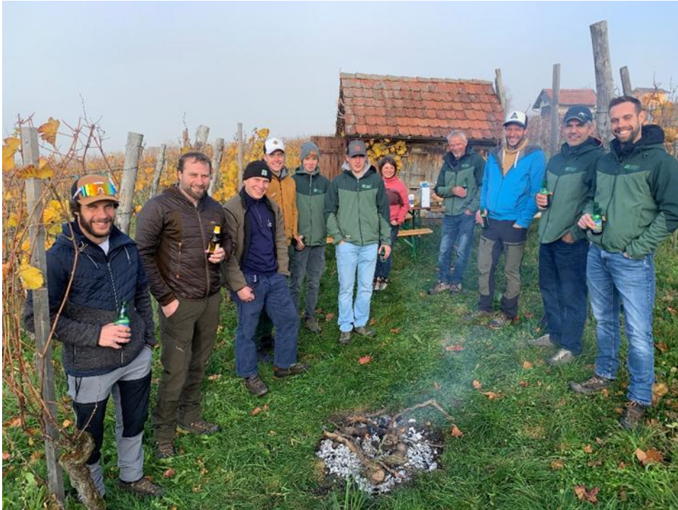
(Abb.) Teamanlass Tamina Forst: