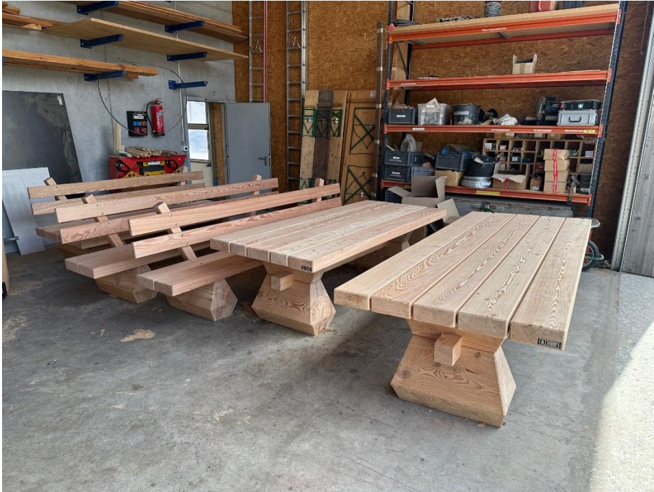
(Abb.) Auftrag Walter Bonderer AG, Vilters