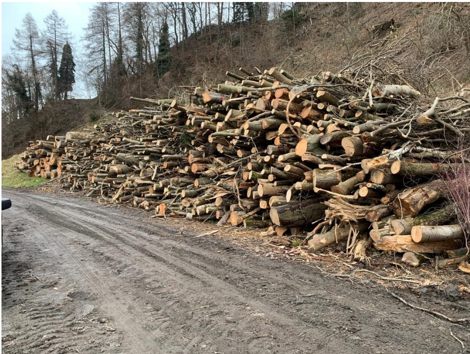
(Abb.) Seilschlag Freudenberg Energieholzpolter