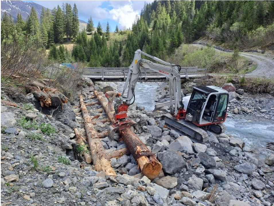
(Abb.) Holzkastenverbauung Calfeisental, Zufahrt Alp Ebni