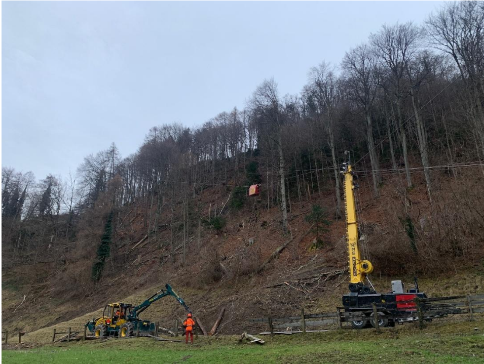
(Abb.) Seilschlag Freudenberg